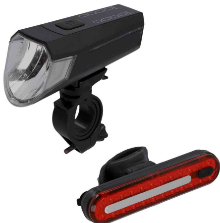
Set d'éclairage de vélo à LED rechargeable, 80 lux