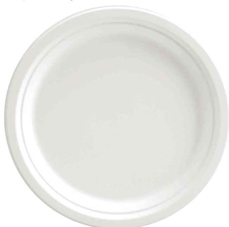
Visuel de référence: Assiette en canne à sucre