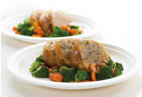
Visuel de référence: présente le produit en utilisation