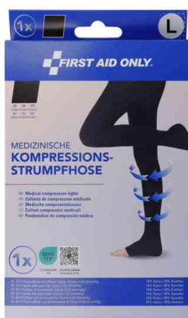
Taille : L