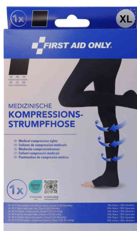
Taille : XL