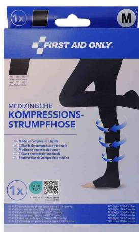
Taille : M