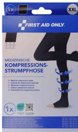
Taille : XXL